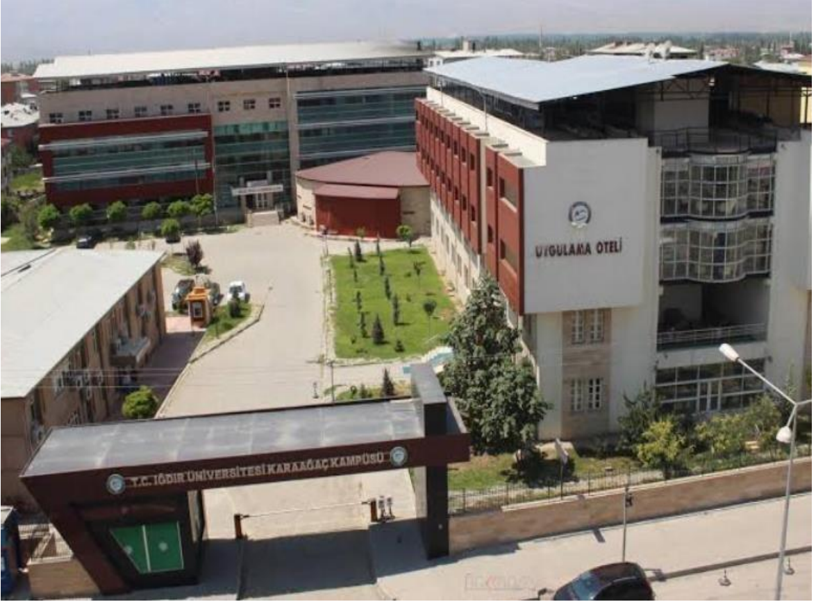
(Şekil 1): Iğdır Üniversitesi Karaağaç Kampüsü