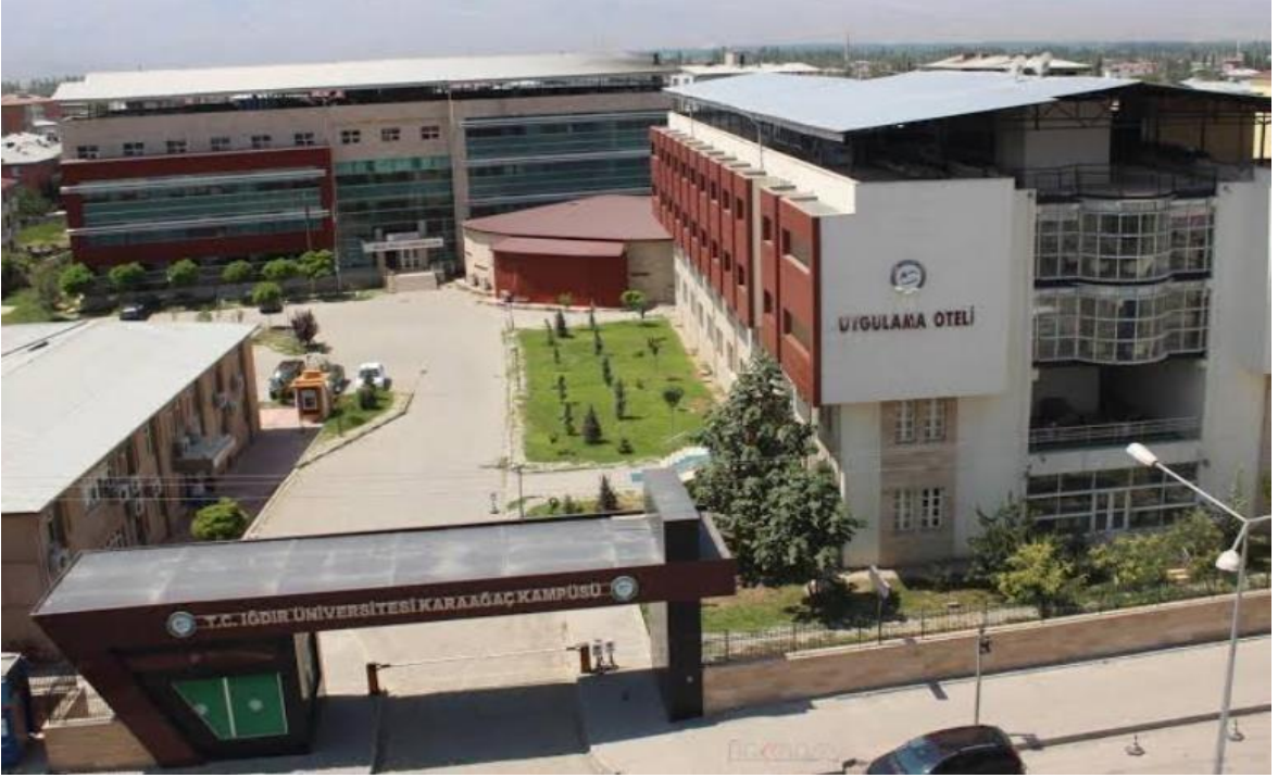
(Şekil 1): Iğdır Üniversitesi Karaağaç Kampüsü