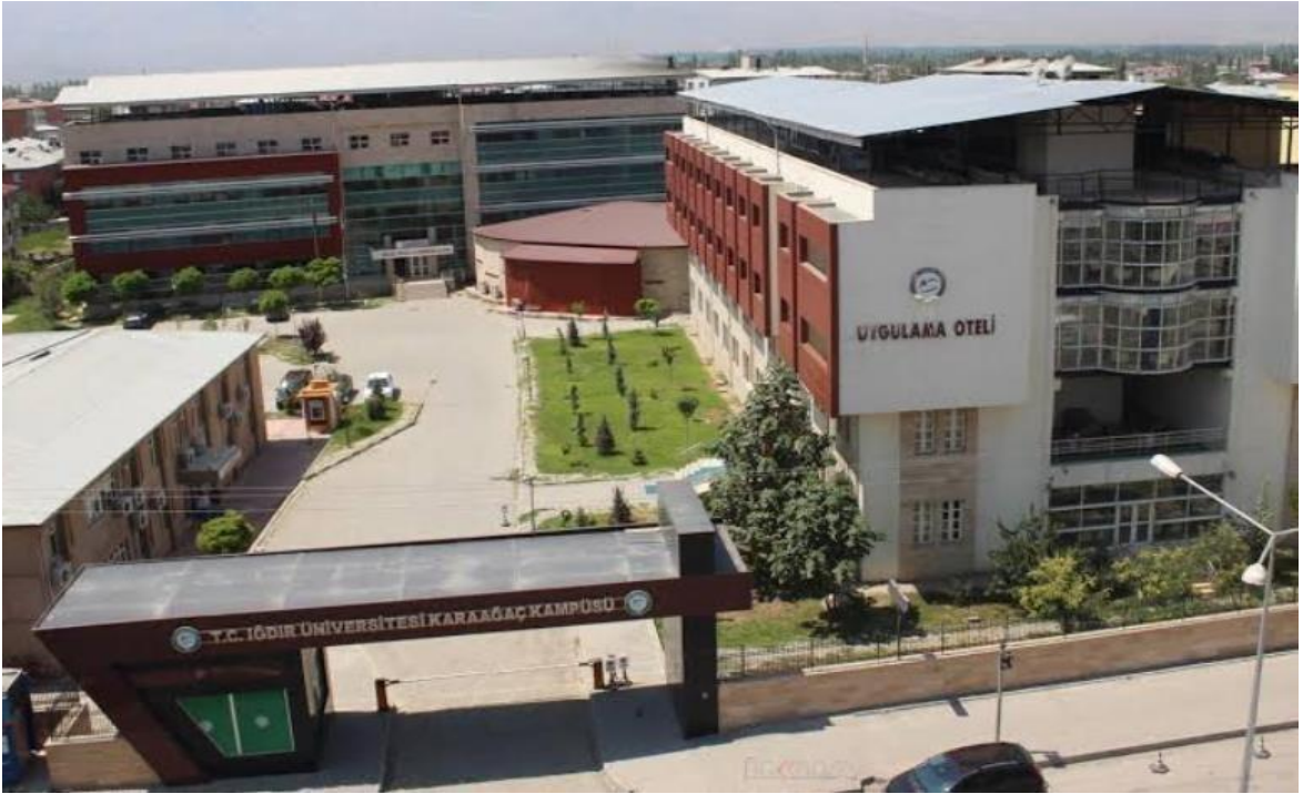
(Şekil 1): Iğdır Üniversitesi Karaağaç Kampüsü